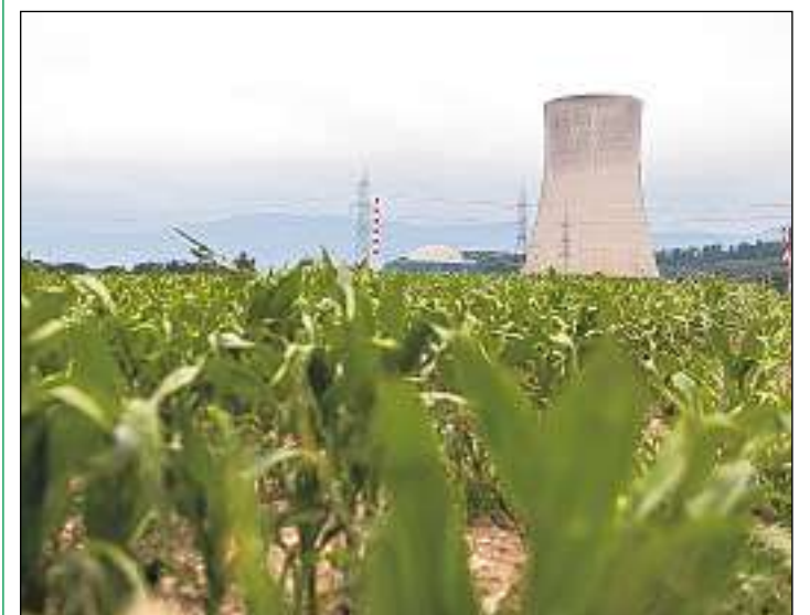
La renunzia ad ovras atomaras n'è betg gratuita.

A Malans èn 3 personas sa blessadas lev tar ina colliisiun tranter 3 autos. L'accident è capità tranter il tunnel dal Karlihof e l'access a l'autostrada sper Landquart. Las personas blessadas èn vegnidas transportadas cun ambulanzas en l'ospital chantunal. Ils 3 vehichels èn donnegiads considerablain.