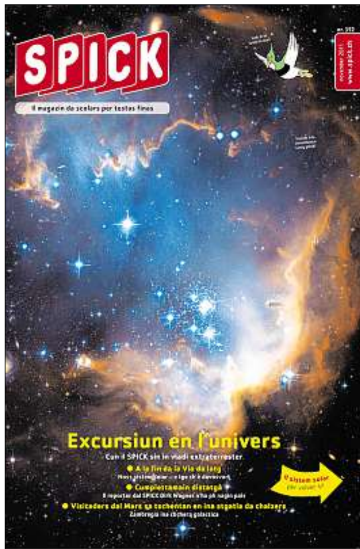
Frontispizi dal nov magazin per scolars rumantschs «Spick».

infurmà ier en damaun èn quai ils custs per la serrada, la fasa finala da manaschi sco era la dismessa da rument radioactiv. Quella nova calculaziun da custs per prender ord funcziun las ovras atomaras svizras custia als gestunaris Alpiq e BKW mintgamai 30 milliuns francs ad onn dapli, communitgeschan las duas societads d'electricitad.